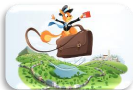
Le Job Abo