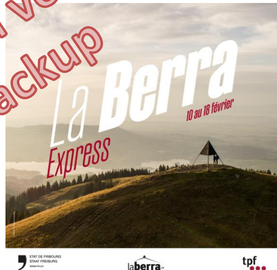
La Berra Express